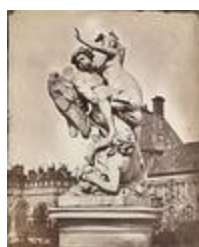
Borée enlevant Orythie, allégorie de l'Air (1684)