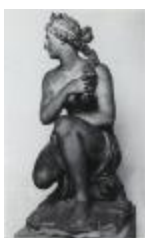
Vénus accroupie ou Vénus pudique, ou Vénus honteuse (1686)