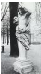
Vertumne ou l'Automne (1686)