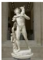
Faune au chevreau (1685)