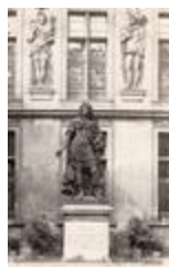
Monument à Louis XIV (1689)