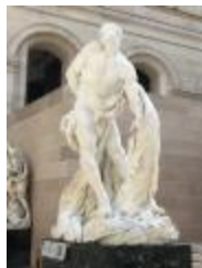
Milon de Crotone. (1682)