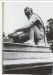
L'Arrotino, ou le Scythe écorcheur, ou le Rémouleur, ou le Rotator ou Milicus (1684)