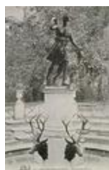
Diane chasseresse, ou Diane à la biche, ou Diane de Versailles (1684)