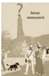
Monument à Henri IV (1838)