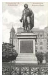
Monument à Kléber (1838)