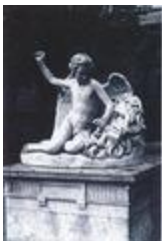
Le Génie de la Sculpture dégrossissant le masque de Jupiter Olympien (1838)