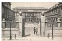
Pierre Puget (1838)