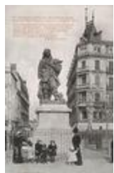
Monument à Pierre-Paul Riquet (1838)