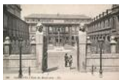
Nicolas Poussin (1838)