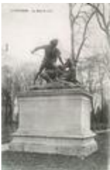
Le Génie de la chasse, dit aussi Hallali ou Le Cerf aux abois ou Le Génie de la chasse triomphant d'un cerf à dix cors (1838)