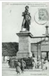
Monument au général Travot (1838)