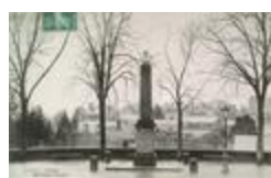
Monument à Charles Duclos-Pinot; Monument à Charles Duclos-Pinot (1838)