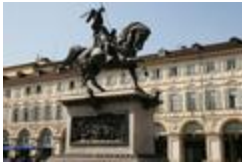
Emmanuel Philibert de Savoie (1838)