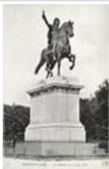
Monument à Louis XIV (1838)