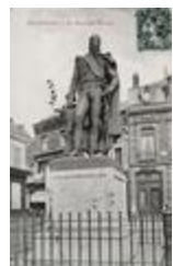
Monument au maréchal Mortier, duc de Trévise (1838)