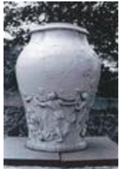
Vase dit de l'Age d'Or, ou La Cueillette ()