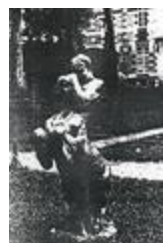
Centaure à la conque (1923)