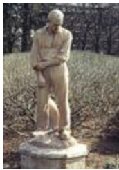
Le Grand paysan (1933)