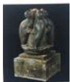
Fontaine aux otaries (1937)