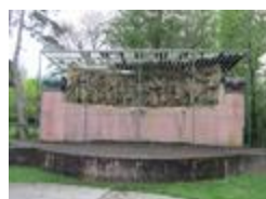
Frise du Travail (1900)