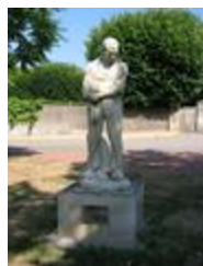
Le Grand Paysan ()