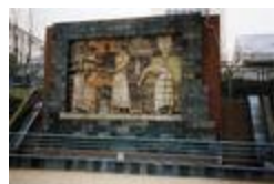
Les Boulangers (1897)