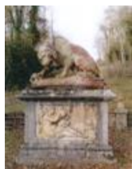
Lion au serpent ()