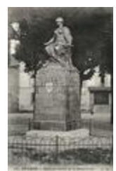
Femme casquée (1900)