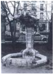
Rire est le propre de l'homme (1925)