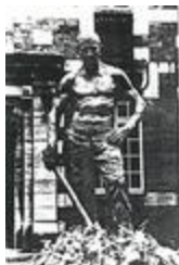
Bucheron de la forêt de la Londe (1899)