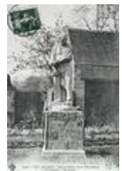
Le Grand paysan ()