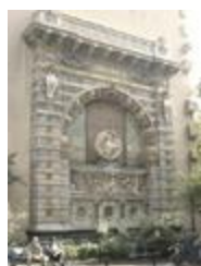
Portique monumental de l'Exposition universelle de 1900 (1900)