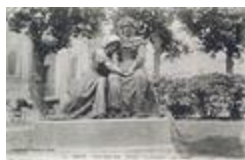
Le Souvenir, ou L'Alsace et la Lorraine (1910)