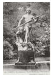
On veille ou les gaulois (1890)