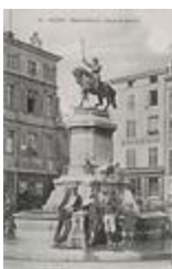
Monument à René II de Lorraine (1883)