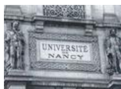
duc Charles III (1862)