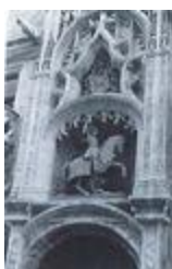
Monument au duc Antoine de Lorraine (1851)