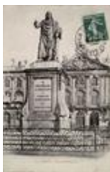
Monument à Stanislas Leszczynski (1831)