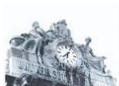
Sciences, Mathématiques et Physique ()