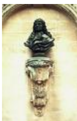
Monument à Israël Sylvestre (1877)