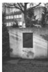
Monument à Camille Cavallier (1926-1931)