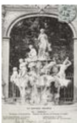
Fontaine d'AmphitriteFontaine d'Amphitrite (1750-1755)