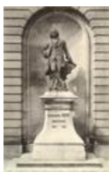
Monument à Emmanuel Héré (1894)