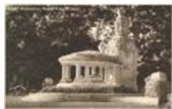
Monument aux morts 1914-1918 (1925)