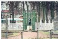
Joueur de flûte, ou Daphnis (1879)