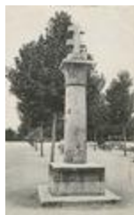
Croix de Lorraine (1934)