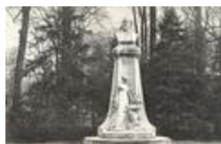
Monument à Charles Sellier (1903)