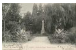
Monument à Jules Crevaux (1885)