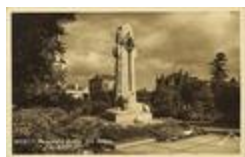
Monument à Albert Ier (1936)