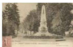
Monument aux morts de 1870 (1871-1913)