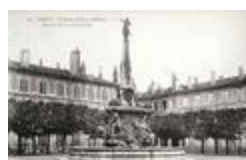
Fontaine d'Alliance (1756)