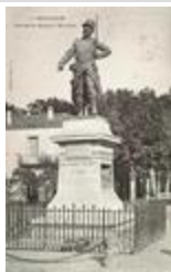
Monument au Sergent Blandan (1887)