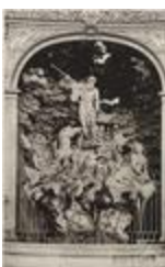
Fontaine de Neptune (1750-1755)