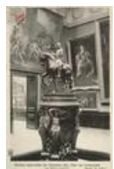
Statue de Charles III duc de Lorraine ()