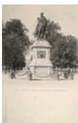
Monument au général Drouot (1853)