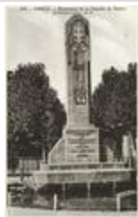
Monument de la Bataille de Nancy, 2 janvier 1477 (1935-1940)