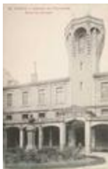
Monument à Dumast (1883-1888)