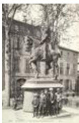
Monument à Jeanne d'Arc (1890)