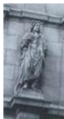
Le roi Stanislas (1862)