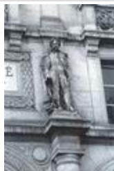
Napoléon III (1862)