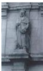
Cardinal de Lorraine (1862)