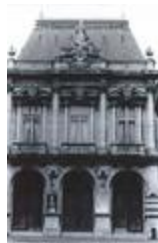
La Ville de Nancy encourageant les Arts ()