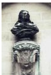
Monument à Ferdinand de Saint-Urbain (1880)