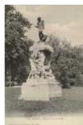
Monument à Claude Gellée dit Le Lorrain (1892)