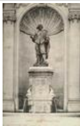
Monument à Jacques Callot (1877)