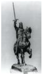
Charlemagne à cheval (1863)