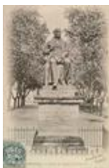
Monument au comte Adrien de Gasparin (1863)