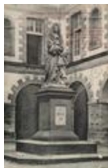
Monument à Jean Domat (1863)