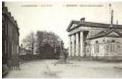
Fontaine Diane de Gabies (1862-1868)