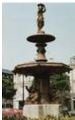
Fontaine Legée-Laherte (1863)