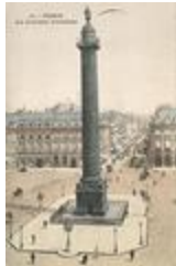
Colonne Vendôme, ou Colonne de la Grande Armée, ou Monument à Napoléon Ier (1863)