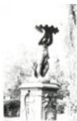
Fontaine à l'enfant portant une coquille géante (1863)