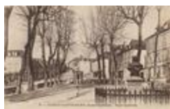
Monument à Navarrot (1862-1868)