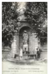
Fontaine Pierre de Luxembourg (1863)