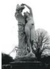
La Bacchante (1863)