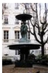
Fontaine Trévis (1860-1865)