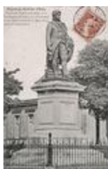
Monument au comte Regnaud de Saint-Jean-d'Angely (1863)