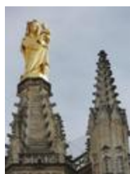
Vierge de la tour Pey Berlan (1863)