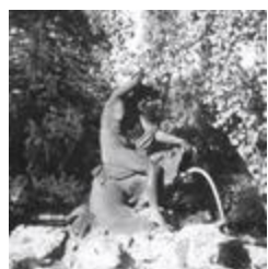
Nymphe tourmentant un dauphin (1863)