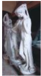
Femme et serpent, dite aussi Vénus (1863)