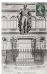
Monument au maréchal Sérurier (1863)