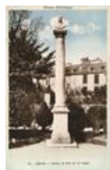
Monument à Charles Néel de La Vigne (1863)