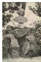
Le bienheureux curé d'Ars (1859-1864)