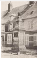
Monument à Antoine Galland (1851-1929)