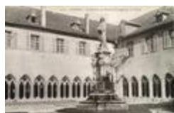
Monument à Schongauer, dit aussi Monument à la mémoire de Martin Shoen (1863)