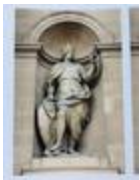
Saint Louis (1706)