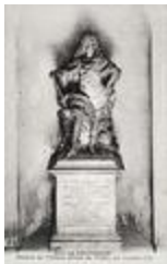
Statue du maréchal Villars (1719)