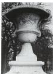
Vase orné de trophées d'instruments de musique (1699)