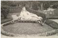
Monument à Henri de Matignon (1682)