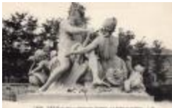
La Seine et la Marne (1712)