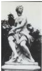
Nymphe de Diane, Nymphe de la chasse, Nymphe à la colombe (1710)