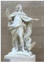
Louis XV en Jupiter (1731)