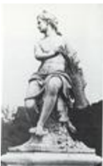
Nymphe de la chasse, dite Nymphe au carquois (1710)