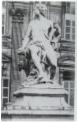
Chasseur au repos, dit Adonis se reposant de la chasse ou Le repos du chasseur (1710)